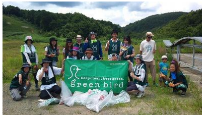
パーククリーン活動（8月）